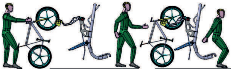
1. Il cliente carica la mountain bike