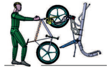
3. Il cliente va dietro la sedile e scarica la mountain bike