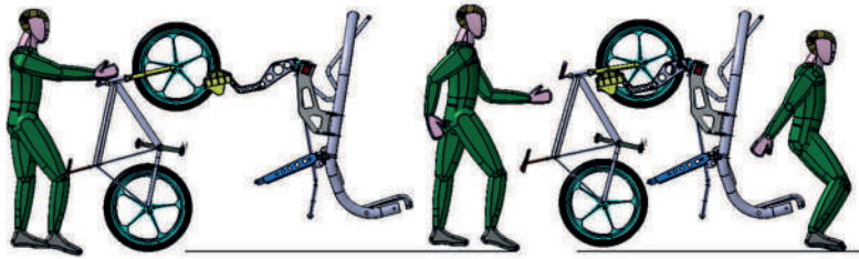
1. Il cliente carica la mountain bike