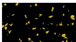
Nero / giallo