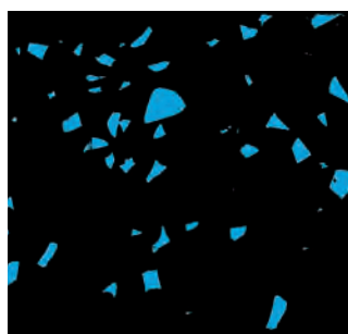
Nero / Blu

Tinte : nero / blu – Altre tinte su richiesta