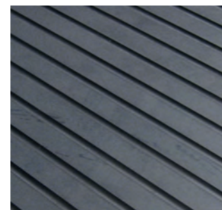
Clip 18 / superficie superiore Clip 18 / superficie inferiore