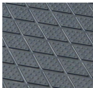
Clip Super / superficie superiore